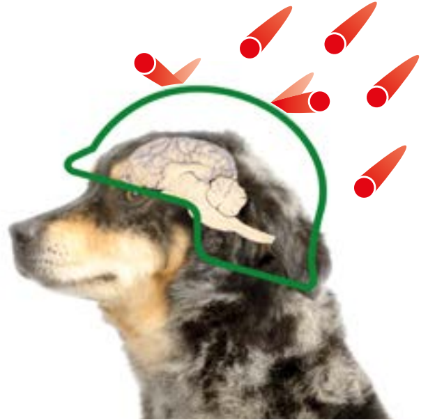
Acción directa protegiendo el cerebro

Interviene en el buen funcionamiento del sistema nervioso gracias a su contenido en vitaminas del grupo B, minerales y aminoácidos esenciales.