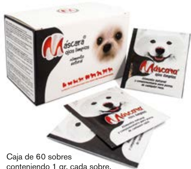
Caja de 60 sobres conteniendo 1 gr. cada sobre.

Máscara® ojos limpios, debe utilizarse durante 60 días, quedando a criterio del especialista aumentar o reducir el tiempo de su consumo. Por su condición de alimento natural presenta efectos deseables en la calidad de las heces. Cuidar su utilización en perras gestantes o lactantes.